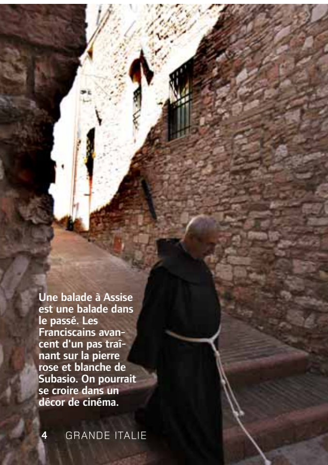
Une balade à Assise est une balade dans le passé. Les Franciscains avancent d'un pas traînant sur la pierre rose et blanche de Subasio. On pourrait se croire dans un décor de cinéma.