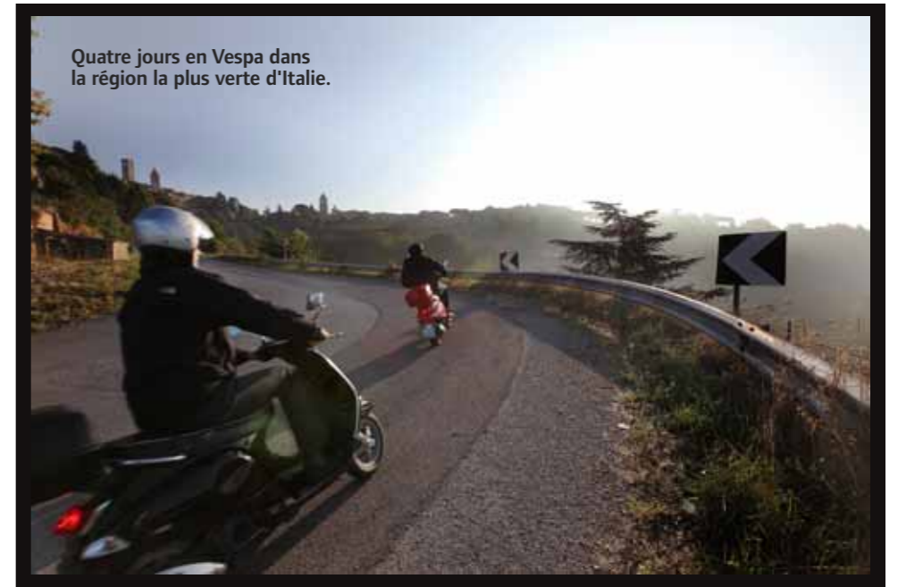
Quatre jours en Vespa dans la région la plus verte d'Italie.

D urant des décennies, les superbes collines d'Ombrie ont été éclipsées par la popularité écrasante de la Toscane, trois fois plus grande. Dans cette région, point de tour penchée ni de beau David de Michel-Ange, pas la moindre côte à l'horizon. Une condition qui, au final, a profité à l'Ombrie, puisque dans son remarquable paysage vallonné et tortueux, la verte nature est restée à ce jour très préservée, baignée de sérénité, ou 'serenità' comme l'on dit par ici. Les villes accrochées aux collines possèdent un rayonnement tellement authentique qu'elles semblent tout droit sorties de l'esprit d'un dessinateur de films d'animation. Leur ambiance est si purement italienne que l'on comprendra aisément pourquoi notre ancien Premier ministre Guy Verhofstadt aurait, selon des sources bien informées, reporté ses faveurs sur l'Ombrie au détriment de la Toscane.