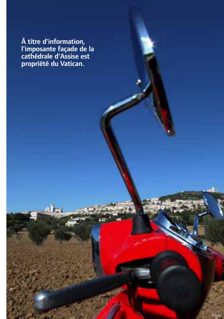
À titre d'information, l'imposante façade de la cathédrale d'Assise est propriété du Vatican.