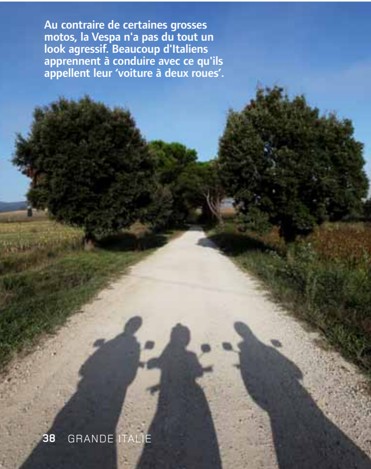
Au contraire de certaines grosses motos, la Vespa n'a pas du tout un look agressif. Beaucoup d'Italiens apprennent à conduire avec ce qu'ils appellent leur 'voiture à deux roues'.