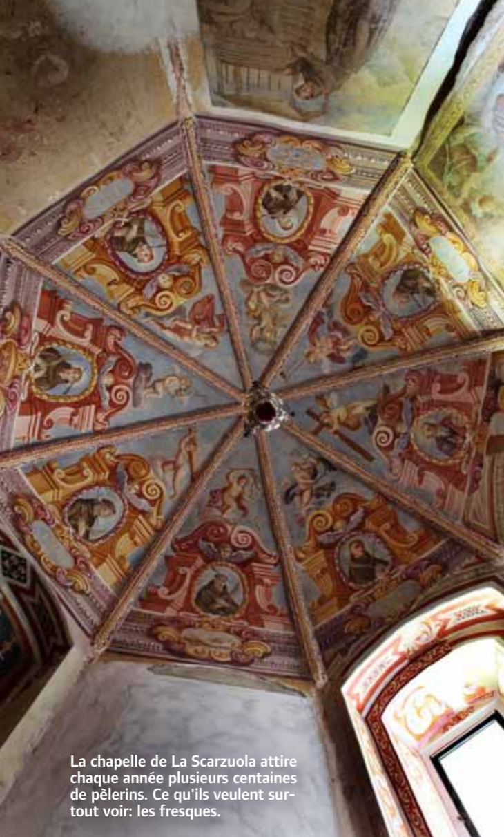
La chapelle de La Scarzuola attire chaque année plusieurs centaines de pèlerins. Ce qu'ils veulent surtout voir: les fresques.

deux ans avant qu'elle soit à nouveau accessible. Ce n'est qu'en septembre dernier, douze ans après la catastrophe naturelle, que s'est terminée la restauration de la fresque du Jugement Dernier.