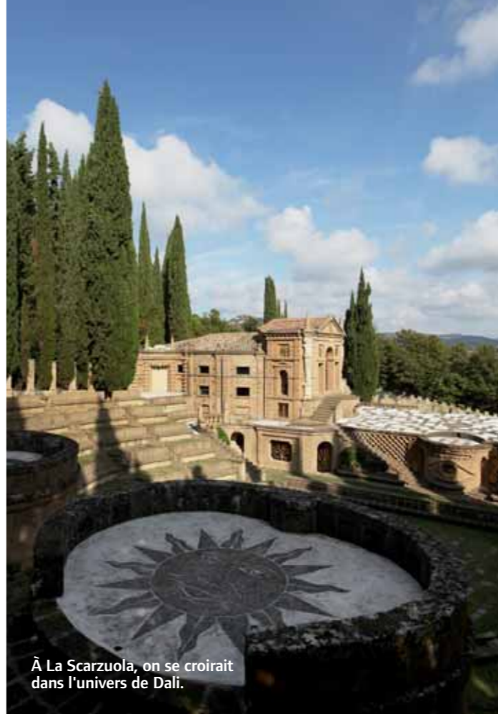
À La Scarzuola, on se croirait dans l'univers de Dali.