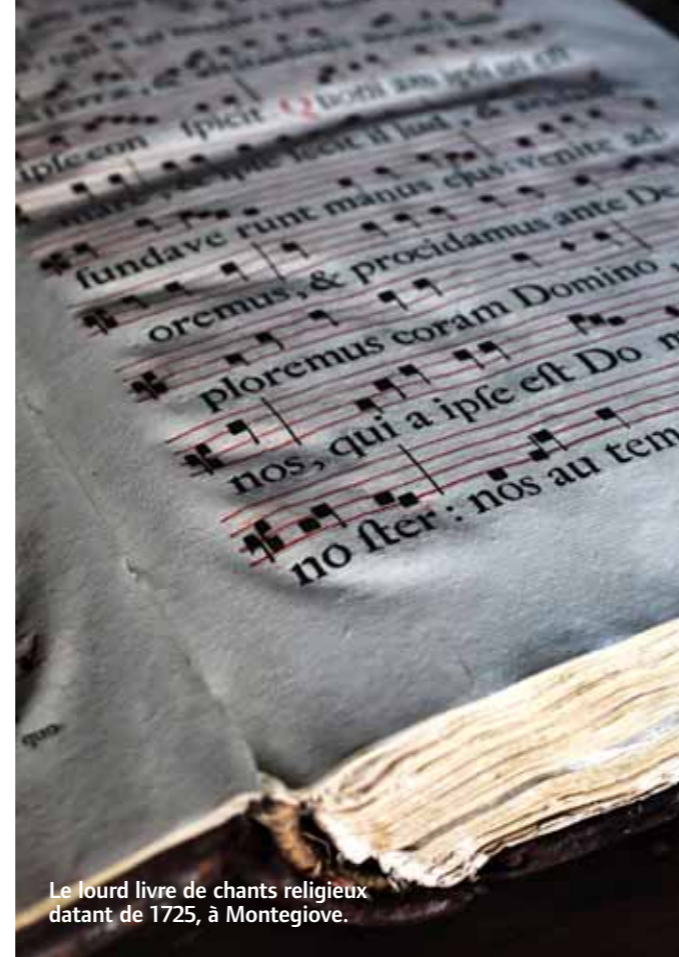
Le lourd livre de chants religieux datant de 1725, à Montegiove.