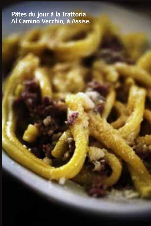
Pâtes du jour à la Trattoria Al Camino Vecchio, à Assise.